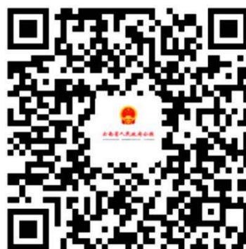
云南省人民政府政府公报支付宝小程序