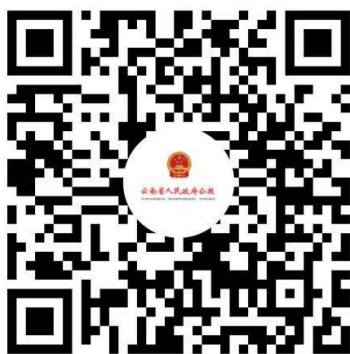
云南省人民政府政府公报微信小程序