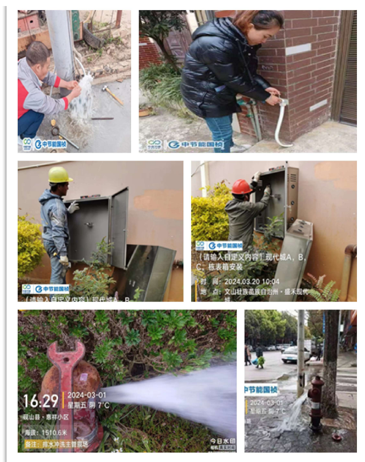
图 3：部分日常工作图